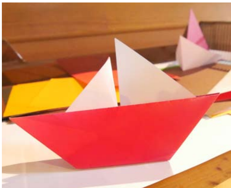
Auf einer Südsee-Insel geht natürlich nichts ohne selbstgemachte - Boote