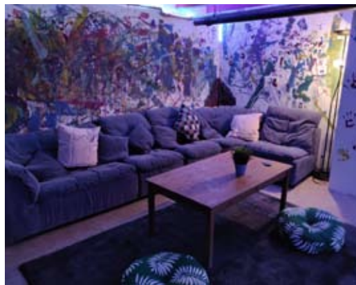
Eindrücke vom erneuerten Jugendraum im Keller des Gemeindehauses: oben: das Team in Aktion; links: „Actionpainting“ und Sofa; unten: das chillige Endergebnis

Tat umgesetzt. Ein Kickertisch, ein Regal und ein Kühlschrank waren bereits organisiert worden. Eine Woche später ging es dann auch schon ans Streichen. Gemeinsam ein Farbkonzept überlegt und ab in den Obi. Wir wollten uns am Actionpainting ausprobieren. Man malt also mit Lappen, Tennisbällen, Händen, Füßen, Zahnbürsten, Strohhalmen, ... was einem gerade so in den Sinn kommt. Fertig gestrichen und geputzt gings dann im Juli ans Einräumen. Mit festem Griff wurde das Sofa zurückgewuchtet und das organisierte Regal und der Kickertisch platziert. Natürlich darf auch ein bisschen Deko nicht fehlen. Mit einem festen Budget von 150 Euro ging es ab zu IKEA und es musste sich gut überlegt werden, was mit kann und was geldtechnisch lieber da bleiben sollte. Das Endergebnis lässt sich sehen. Lichterketten, kuschelige Kissen fürs Sofa und ein paar Pflanzen lassen den Raum in einem ganz anderen Licht erstrahlen.