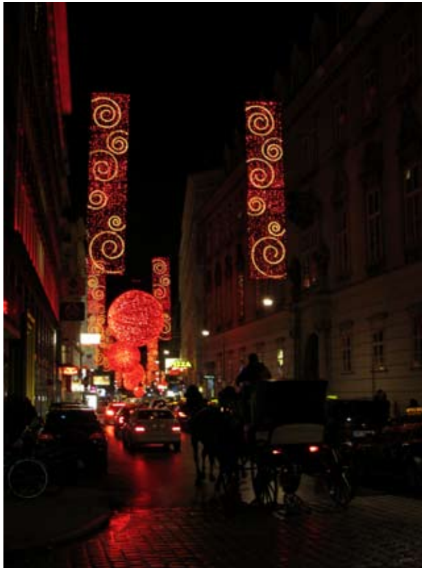
Weihnachtliche Festbeleuchtung in Wien

Die fünfte Strophe darin lautet: „Nichts, nichts hat dich getrieben / zu mir vom Himmelszelt / als das geliebte Lieben, / damit du alle Welt / in ihren tausend Plagen / und großen Jammerlast, / die kein Mund kann aussagen, / so fest umfassen hast.“