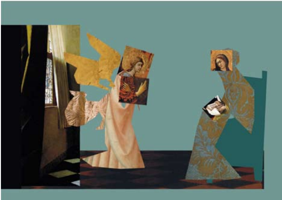
Barbara Gsaenger: Szenen aus dem Leben Marias

Meine Vorliebe für Rilkes Gedichte und die zufällig gleichzeitige Beschäftigung mit den Bildern der Renaissance hat mich auf die Idee zu den Collagen gebracht. Ein Bild ist schöner und beeindruckender