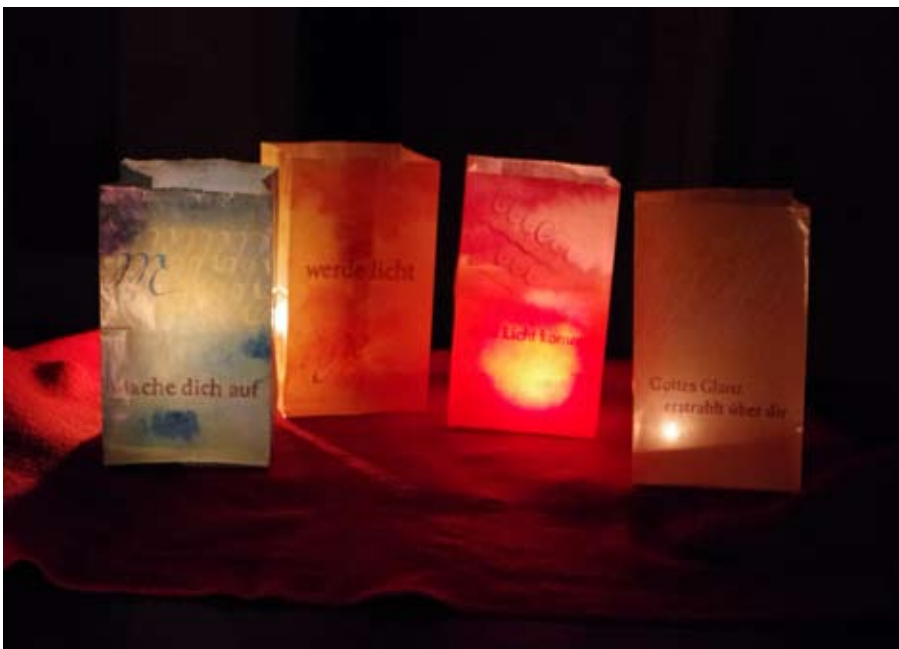
Adventliche Stimmung in der Kirche