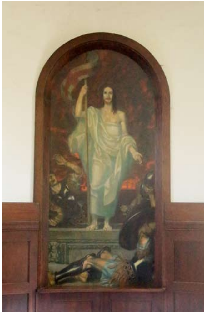
Das Altarbild in der Sakristei der Auferstehungskirche

Hand vors Gesicht schlägt. In ihm kann sich der Betrachter des Bildes wiederfinden, der bis zu diesem Zeitpunkt des Geschehens lediglich die beiden kleinen schwarzen Kreuze vor Augen hatte, die