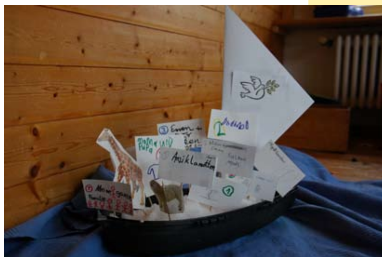
Die Kinder füllen ein Schiff mit Dingen, die sie auf die Arche Noah mitnehmen würden – die meisten Kinder haben als erstes ihre Familien eingepackt

Die philosophischen Gespräche eröffneten den Kindern Raum und Zeit sich mit Inhalten auseinanderzusetzen, die oftmals in unserer heutigen Gesellschaft keinen rechten Platz